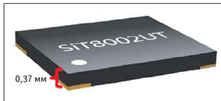
Рис. 3. Генератор SiTime SiT8002UT