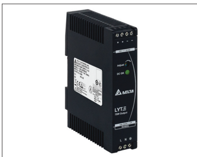
Рис. 1. Блок питания серии Lyte для крепления на DIN-рейку

Delta Electronics представляет самую тонкую модель из серии блоков питания на DIN-рейку Lyte (см. рис. 1,