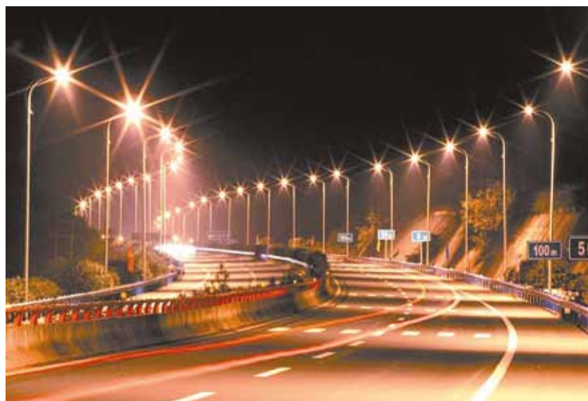
Рис. 2. «Зебра» на дороге из-за низкой равномерности яркости

В одних технических заданиях встречается проектирование УНО в соответствии с ГОСТ Р 54305–2011 (только по освещенности), в других – СП 52.13330.2011 (по яркости и освещенности) . При учете только требований к освещенности часто получают «зебру» на дороге. Дело в том, что равномерность освещенности никак не характеризует равномерность яркости. По-