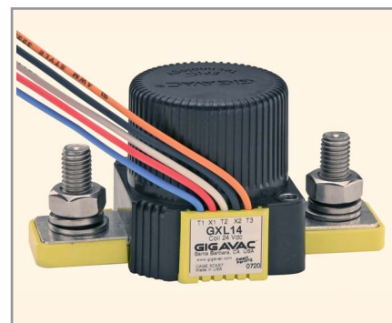
Рис. 3. Контактор серии GXL14

ромагнитную интерференцию) в схеме управления. Одним из преимуществ данных контакторов является наличие встроенной системы гашения ЭДС самоиндукции, что исключает необходимость во внешней системе гашения. Изготовление монтажных элементов из нержавеющей стали является гарантией отсутствия коррозии в течение многих лет эксплуатации.