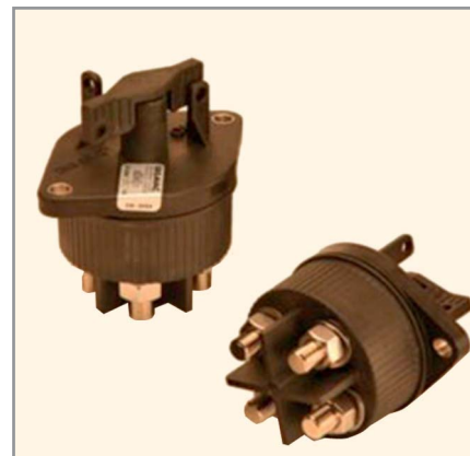
Рис. 6. Переключатель серии BD9521

Расширяя номенклатуру силовых изделий, компания Gigavac представляет свой первый продукт в новой линейке, – небольшой и недорогой переключатель P105 MiniTactor (см. рис. 5). Герметичный и лёгкий (менее 100 г) P105 дополняет линейку высоковольтных реле и герметичных контакторов и может быть установлен на панели в любом положении в течение нескольких секунд. Герметичная камера для контактов и катушки обеспечивает переключение в любых условиях. Безопасное замыкание и размыкание осуществляется при напряжении до 1500 В постоянного тока. Благодаря возможности коммутировать ток до 50 А, переключатель MiniTactor является идеальным выбором для систем зарядки аккумуляторных батарей и оборудования для солнечной энергетики.