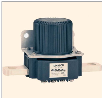
Рис. 4. Контактор серии MX56

для осуществления коммутации контактов. В замкнутом положении контакты удерживаются при помощи постоянного магнита, что позволяет контакторам работать без тепловыделения.