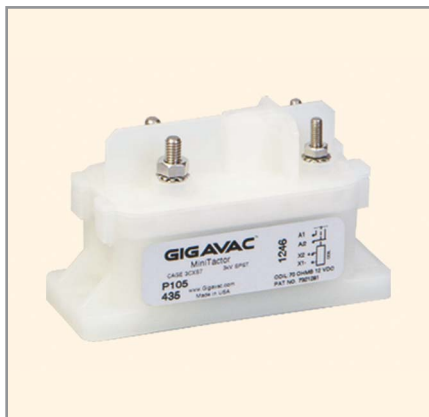
Рис. 5. Переключатель серии P105

Последней разработкой в линейке MX стал контактор MX56 (см. рис. 4). Однополюсный нормально открытый (SPST-NO) контактор MX56 рассчитан на непрерывную работу и коммутацию (до 100 000 раз) тока 600