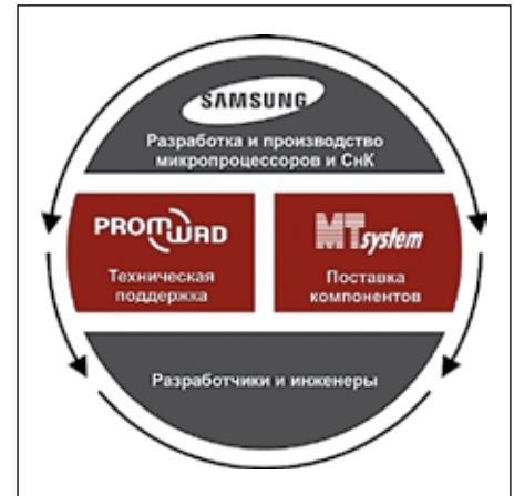
Рис. 3. Доставка и техническая поддержка электронных компонентов Samsung на российском рынке

ным характеристикам ARMADA618 стоит отметить более быструю шину к памяти.