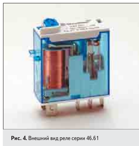
Рис. 4. Внешний вид реле серии 46.61

ле 50.12 составляет 0,2 А при напряжении 220 В (постоянный ток).