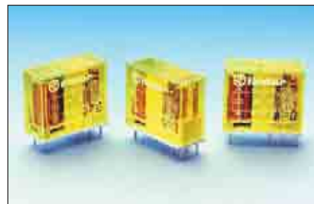
Рис. 1. Внешний вид реле серии 50.12

щитные реле на ток до 8 А (серия 50), миниатюрные промышленные реле на токи 8–16 А (серия 46), миниатюрные реле общего назначения с максимально допустимым током 7–10 А (серия 55), миниатюрные мощные реле на ток до 12 А (серия 56), а также реле общего назначения (серия 60 с максимальным током до 6–10 А, серия 62 — до 16 А, серия 65 — токи до 20–30 А и серия 66 — до 30 А). Как видно, благодаря такому разнообразию линейки реле различного назначения, всегда мож-