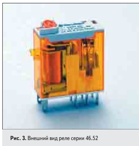
Рис. 3. Внешний вид реле серии 46.52